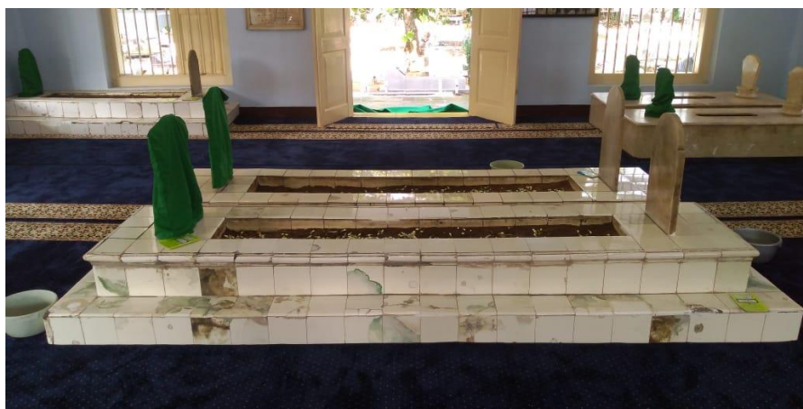
Gambar 1. Situs Makam Sapuro

Pembelajaran matematika dengan mengaitkan lingkungan sekitar dapat dilakukan dengan memanfaatkan budaya atau biasa dikenal etnomatematika. Banyak kearifan lokal di Kota Pekalongan yang dapat digunakan dalam pembelajaran matematika, salah satunya adalah situs makam Sapuro. Tidak hanya mengandung nilai kearifan lokal, di dalam situs makam Sapuro juga terkandung nilai religiusitas. Dalam kompleks makam tersebut terdapat makam seorang habib bernama Ahmad Bin Abdullah Bin Tholib Al Athas, yang dikenal sebagai tokoh penyebar agama Islam di Kota Pekalongan dan sekitarnya. Gambar 1 berikut menunjukkan keadaan situs makam Sapuro, yaitu habib Ahmad Bin Abdullah Bin Tholib Al Athas.