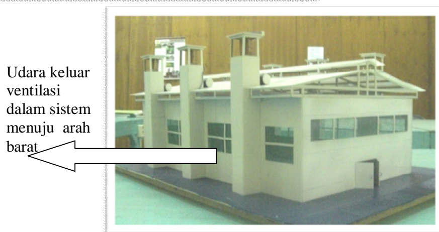
Gambar 1. Desain Prototipe Ruang Proses Produksi